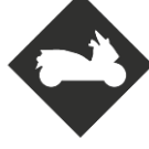
PERMIS MAXI SCOOTER